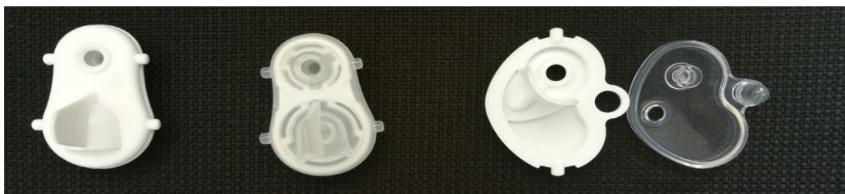
Jednodílný bílý ventilek